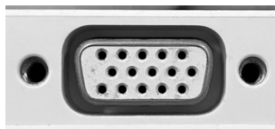
D-sub15 ピン メス